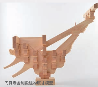
円覚寺舍利殿組物原寸模型