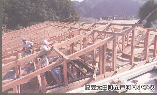
安芸太田町立戸内小学校