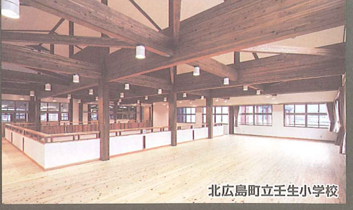
北広島町立壬生小学校